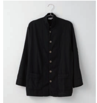
ガーゼパジャマ 2重合わせ 黒 SS・S・M・L・LL