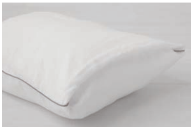
ガーゼ枕カバー 3重合わせ M・L マスタード・グレー