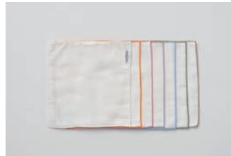
ガーゼハンカチ 3重合わせ ベージュ・ホワイト・ピンク・オレンジ うす紫・水色・緑