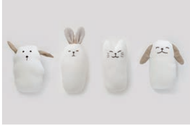
にぎにぎ 3重合わせ うさぎ・ねこ・ひつじ・いぬ