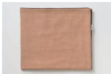
ガーゼバスタオル 5重合わせ 柿渋