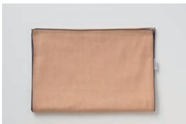
ガーゼフェイスタオル 5重合わせ 柿渋