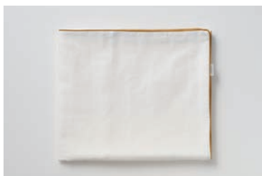
ベビーガーゼ 湯上げタオル 3重合わせ マスタード・グレー