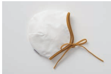
ベビーガーゼぼうし 4重合わせ マスタード・グレー