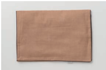
ガーゼ枕カバー 3重合わせ 柿渋 M・L