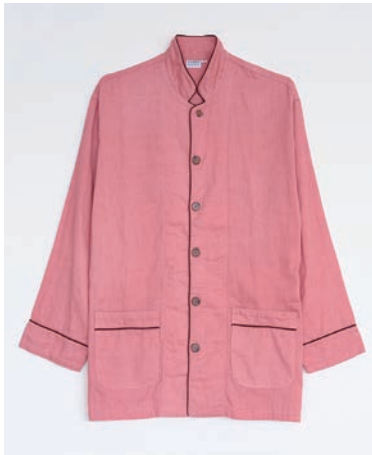
ガーゼパジャマ 2重合わせ さんご/上下セット SS・S・M・L・LL