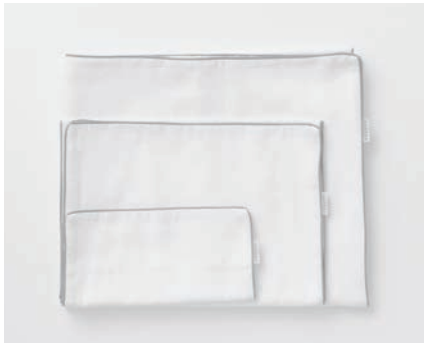
ガーゼハンドタオル 5重合わせ ガーゼフェイスタオル 5重合わせ ガーゼバスタオル 5重合わせ マスタード・グレー