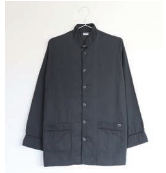
ガーゼパジャマ 2重合わせ チャコールグレー S・M・L・LL