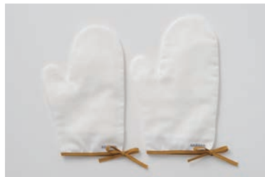
ベビーガーゼミトン 3重合わせ M・L マスタード・グレー