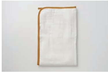
ガーゼ敷パッド 5重合わせ S・D マスタード・グレー