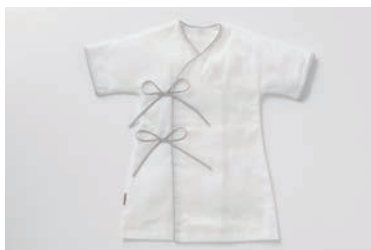
ベビーガーゼ ロープ 3重合わせ マスタード・グレー