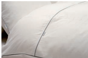
ガーゼ掛布団カバー 2重合わせ S・SD・D・Q・K マスタード・グレー