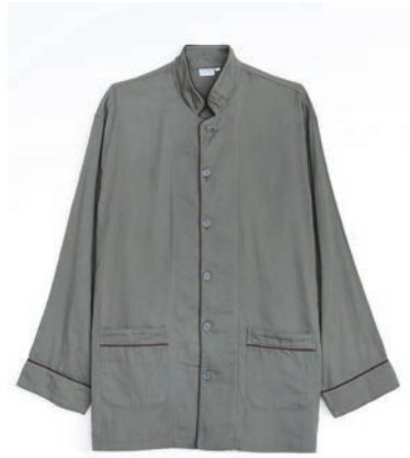
ガーゼパジャマ 2重合わせ すみくろ/上下セット SS・S・M・L・LL