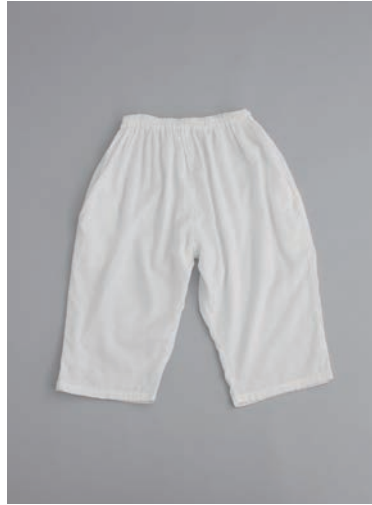
ガーゼラウンジパンツ 2重合わせ