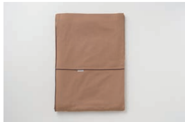
ガーゼ掛布団カバー 2重合わせ 柿渋 S・SD・D・Q・K