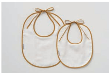
ベビーガーゼ bib(前掛け) 5重合わせ 大・小 マスタード・グレー