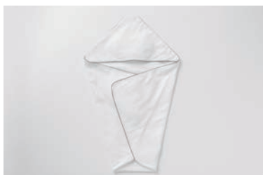
ベビーガーゼ アフガン 5重合わせ マスタード・グレー