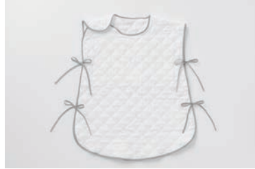
ベビーガーゼスリーパー (脱脂綿キルト) マスタード・グレー