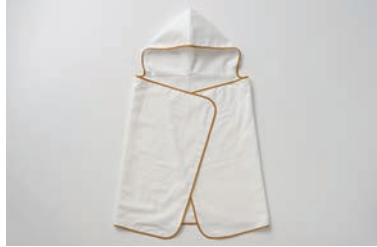
ベビーガーゼフードつきタオル 4重合わせ マスタード・グレー