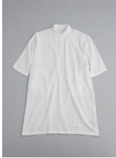
ガーゼシャツワンピース 2重合わせ