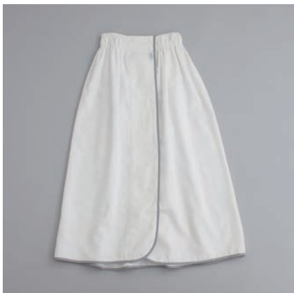
ガーゼラップ タオル 4重合わせ グレー