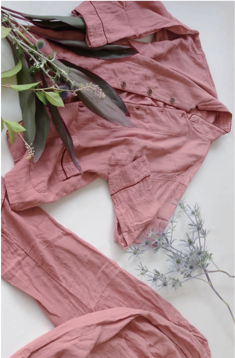
Herbal-Dyed SANGO さんご