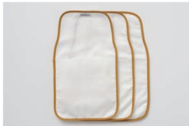
ベビーガーゼあせとり 4重合わせ(3枚セット) マスタード・グレー