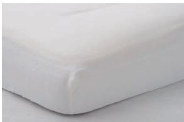
ガーゼボックスシート 3重合わせ S・SD・D・Q・K