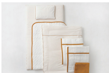
ベビーふとん 10点セット マスタード・グレー