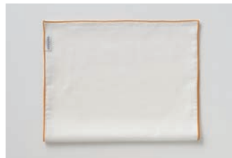
ガーゼ浴用タオル 2重合わせ マスタード・グレー