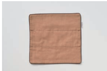
ガーゼハンドタオル 5重合わせ 柿渋