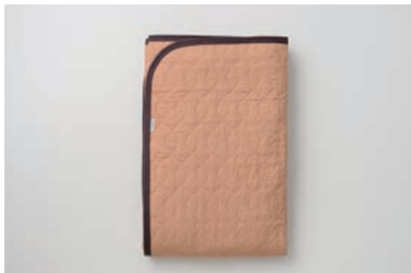
ガーゼ敷きパッド(脱脂綿入り) 4層 柿渋 S・SD・D