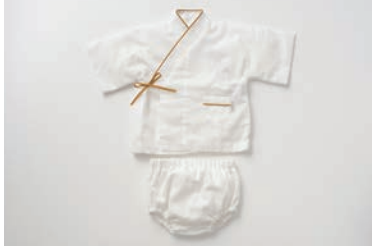
ベビーガーゼじんべい 3重合わせ マスタード・グレー