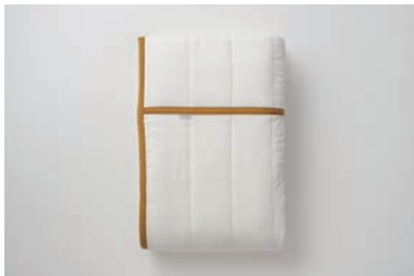
ガーゼケット(脱脂綿入り) 5層 S マスタード・グレー