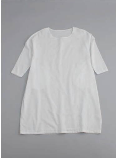
ガーゼラウンドネックワンピース 2重合わせ