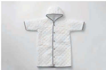
ベビーガーゼおくるみ (脱脂綿キルト) 2重合わせ マスタード・グレー