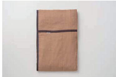
ガーゼケット 5重合わせ 柿渋 S