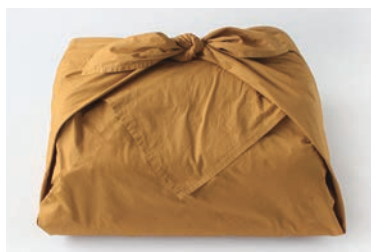
ベビーふとん 10点セットは、大判風呂敷で全て まとめて包むことができます。