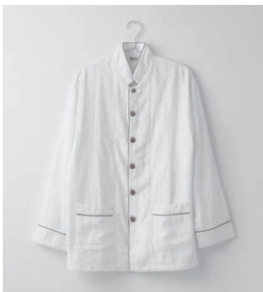
ガーゼパジャマ 2重合わせ/3重合わせ 白 上下セット SS・S・M・L・LL マスタード・グレー