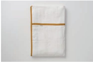
ガーゼケット 5重合わせ S マスタード・グレー