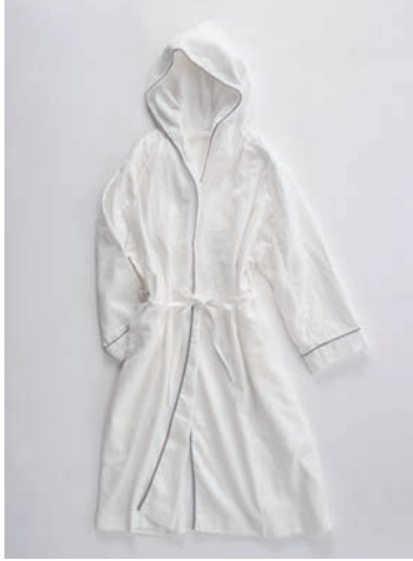
ガーゼフードつきローブ 3重合わせ グレー