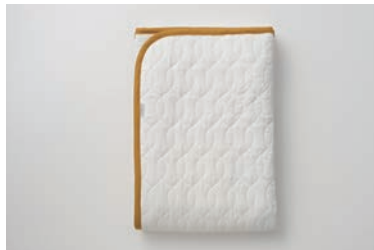
ガーゼ敷パッド(脱脂綿入り) 4層 S・SD・D マスタード・グレー