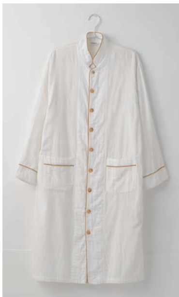
ガーゼロングパジャマ 2重合わせ 白 上下セット S・M・L マスタード・グレー