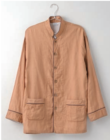
ガーゼパジャマ 2重合わせ/3重合わせ 柿渋/上下セット SS・S・M・L・LL