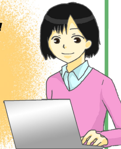
サービス提供責任者・管理者さん