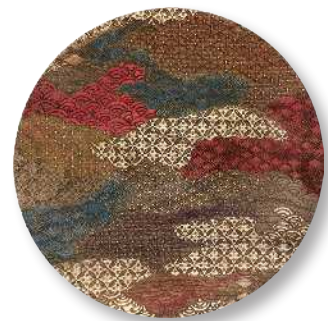
京小紋 - 彩 PT-KKM-0010