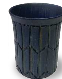
矢拵 - 生成り GU-YZK-0004