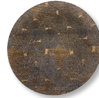
菊尽くし - 黒 PT-CTD-0004