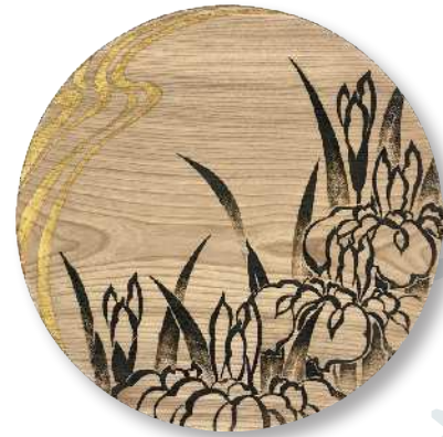
流水と菖蒲 (大) PT-RSA-0016 φ 27.5 × 2.0cm 栃 (国産) ¥23,100 (税抜 ¥21,000)