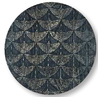
群鶴 - 青黒 PT-GNZ-0012