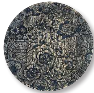
京友禅尽くし - 黒 PT-KYZ-0002