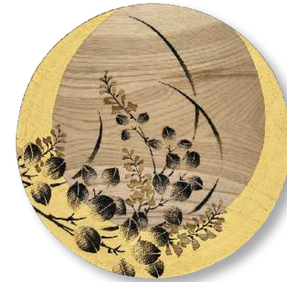
三日月と萩 (大) PT-MTH-0016 φ 27.5 × 2.0cm 栃 (国産) ¥23,100 (税抜 ¥21,000)