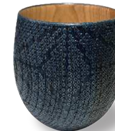
正田麻型 - 生成り TP-HAS-0004