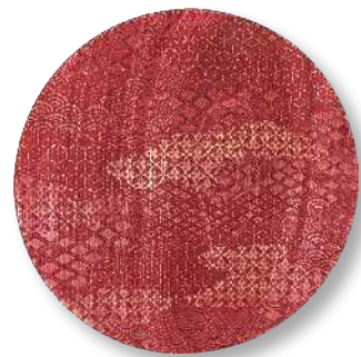
京小紋 - 赤 PT-KKM-0001