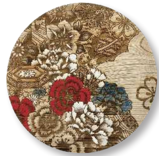
京友禅尽くし - 彩 PT-KYZ-0010