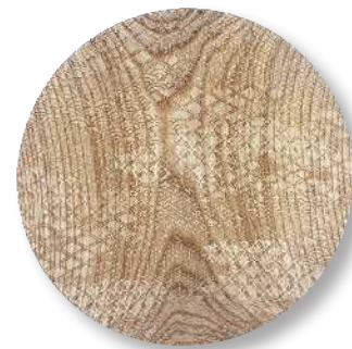
京小紋 - 生成り PT-KKM-0004