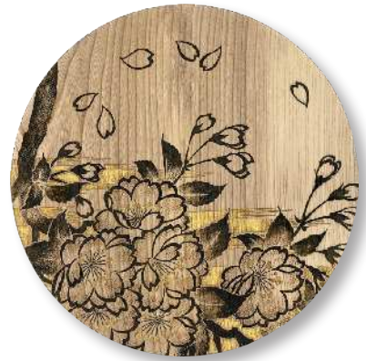
桜吹雪 (大) PT-CBS-0016 φ 27.5 × 2.0cm 栃 (国産) ¥23,100 (税抜 ¥21,000)