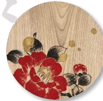
雪に椿 (大) PT-YNT-0016 φ 27.5 × 2.0cm 栃 (国産) ¥23,100 (税抜 ¥21,000)