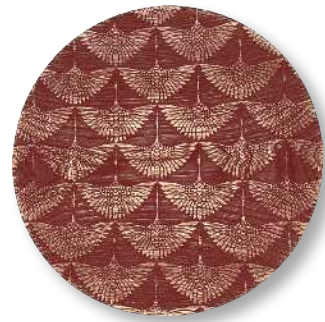
群鶴 - 朱 PT-GNZ-0013