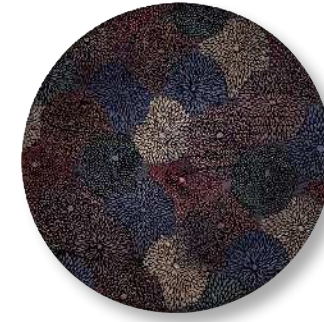
菊尽くし - 彩 PT-CTD-0010