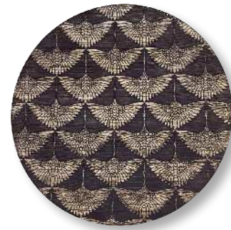
群鶴 - 黒 PT-GNZ-0002