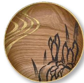
流水と菖蒲 (小) TZ-RSA-0016 φ 15.0 × 2.0cm 榎 (国産) ¥7,920 (税抜 ¥7,200)