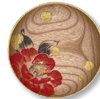
雪に椿 (小) TZ-YNT-0016 φ 15.0 × 2.0cm 榎 (国産) ¥7,920 (税抜 ¥7,200)