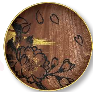
桜吹雪 (小) TZ-CBS-0016 φ 15.0 × 2.0cm 榎 (国産) ¥7,920 (税抜 ¥7,200)