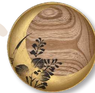
三日月と萩 (小) TZ-MTH-0016 φ 15.0 × 2.0cm 榎 (国産) ¥7,920 (税抜 ¥7,200)