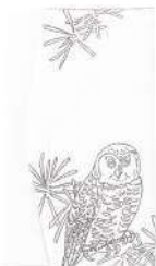
ふくろう / 白