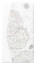
樺 / 白