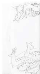
鹿 / 白