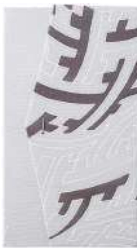
紗綾形 / グレー