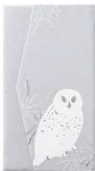
ふくろう / グレー