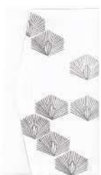
松 / 白