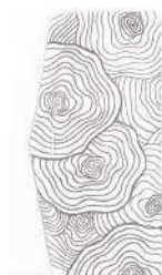
樺 / 白