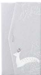
鹿 / グレー