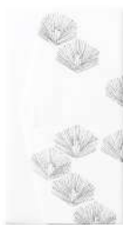
松 / 白