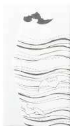
こもり / 白