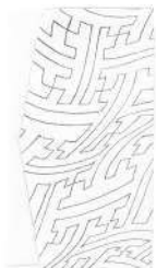
紗綾形 / 白