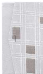
格子 / グレー

絵柄は熟練の職人により手で描かれています。組紐も一つ一つ丁寧に手編みで仕上げております。そのため、色柄や形に若干の違いがある場合がございますのでご了承ください。