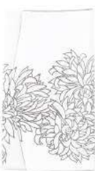
菊 / 白