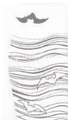
こもり / 白