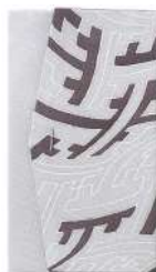
紗綾形 / グレー