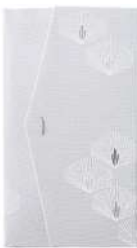
松 / グレー