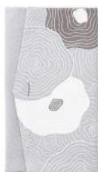
樺 / グレー