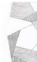
氷割れ / 白