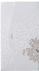
菊 / グレー