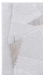
氷割れ / グレー