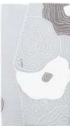
樺 / グレー