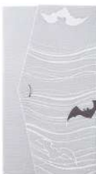
こもり / グレー