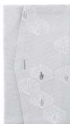
松 / グレー