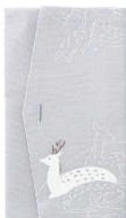
鹿 / グレー