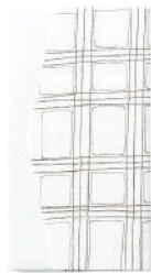
格子 / 白