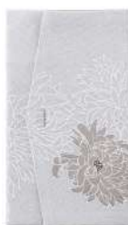
菊 / グレー