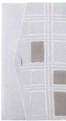
格子 / グレー

絵柄は熟練の職人により手で描かれています。組紐も一つ一つ丁寧に手編みで仕上げております。そのため、色柄や形に若干の違いがある場合がございますのでご了承ください。