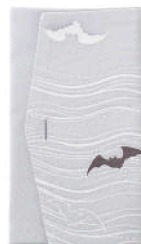
こもり / グレー