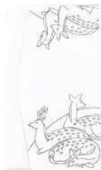
鹿 / 白