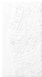
紗綾形 / 白