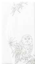
ふくろう / 白