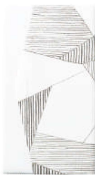
氷割れ / 白