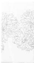
菊 / 白