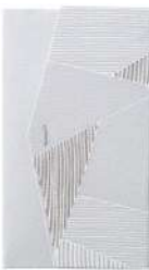
氷割れ / グレー