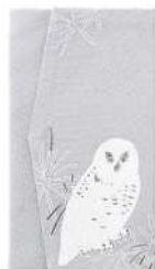
ふくろう / グレー